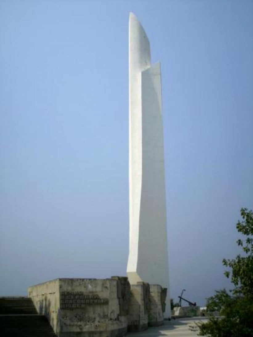
Обелиск «Штык-парус» в честь присвоения Севастополю звания «Город-герой»