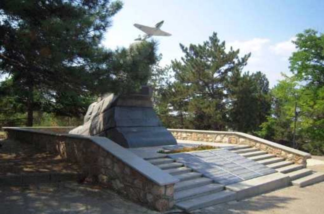
Памятник мужеству авиаторов-черноморцев