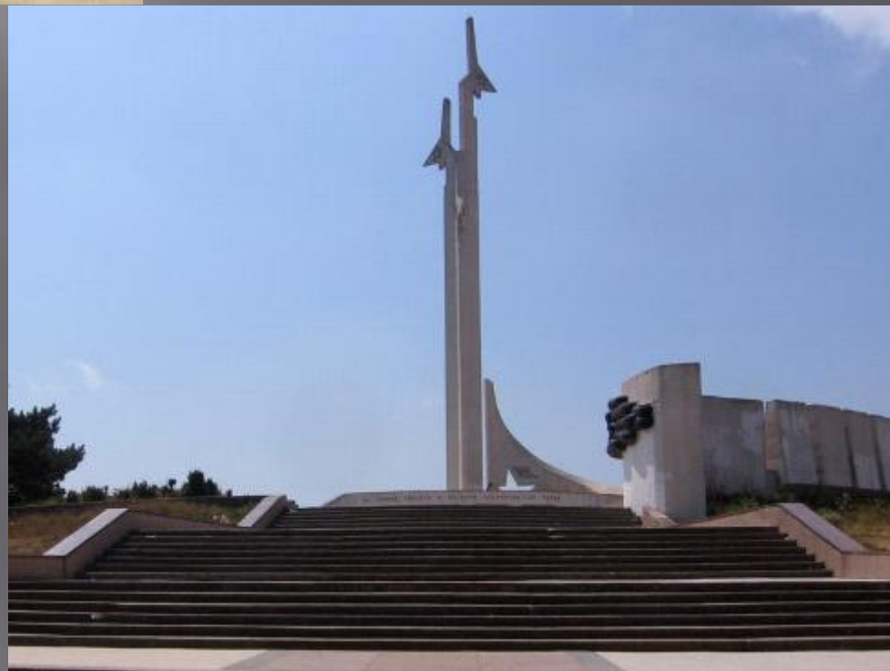
Памятник лётчикам на Малаховом кургане